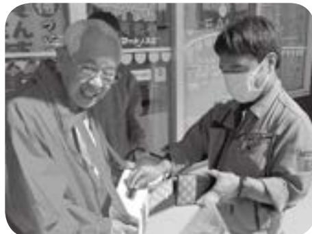
▲ サンマート人丸店