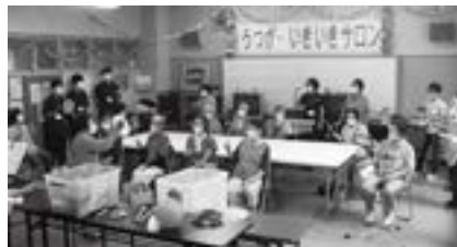
▲ボランティア活動・サロン訪問

地域の皆様のご協力により、無事に終わることができました。ありがとうございました。