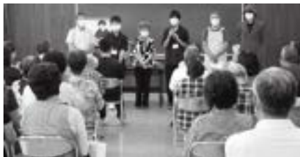
▲福祉員研修会にて、寸劇に挑戦！