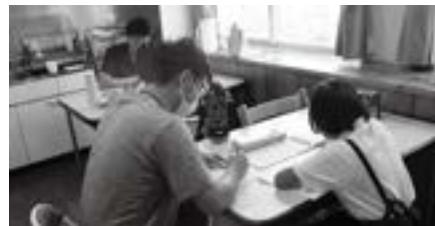
▲入所児と一緒に勉強中・・・